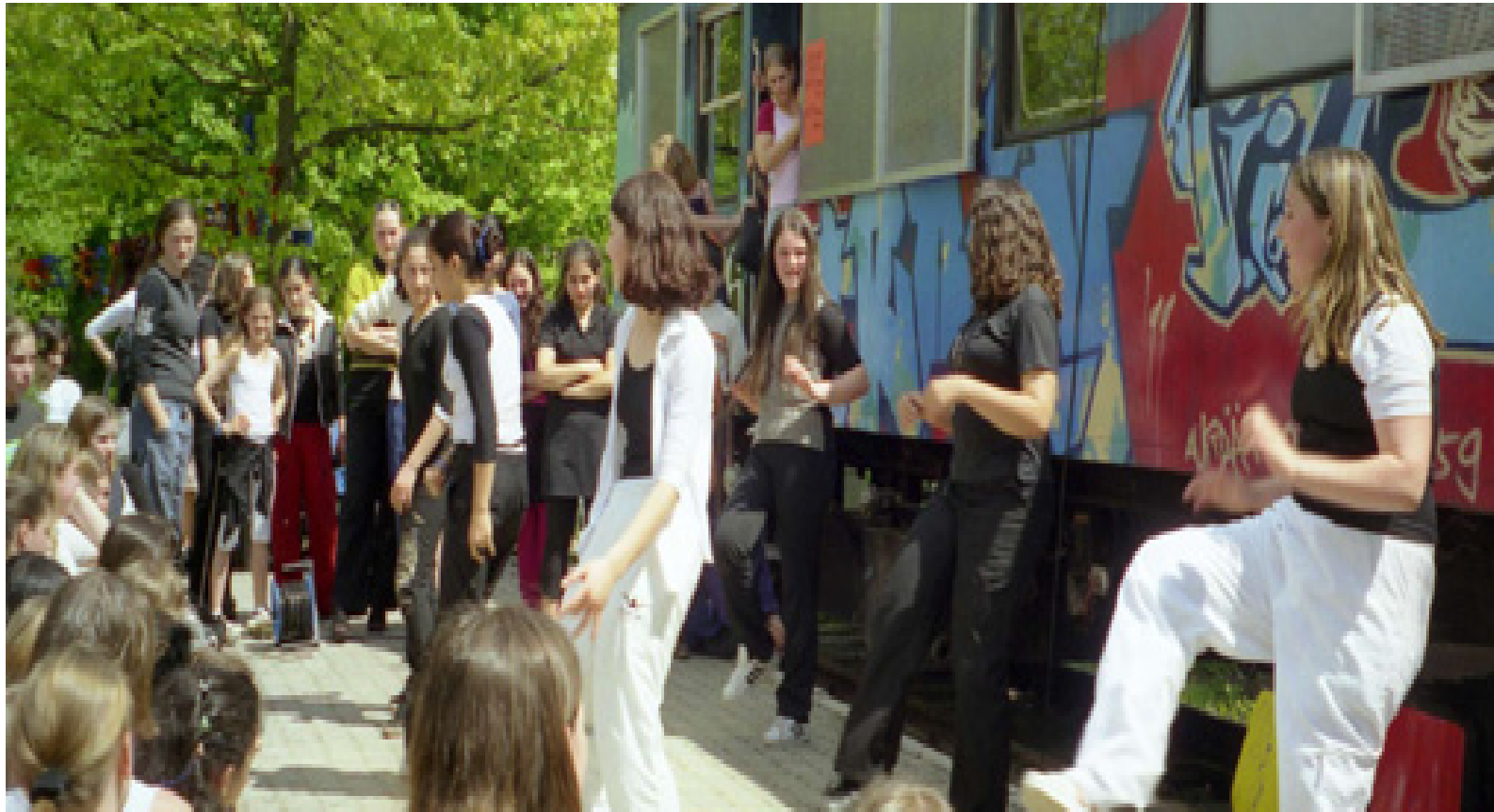
„Der Waggon“ Kooperationsprojekt Jugendarbeit und Schule, Jugendamt Kassel