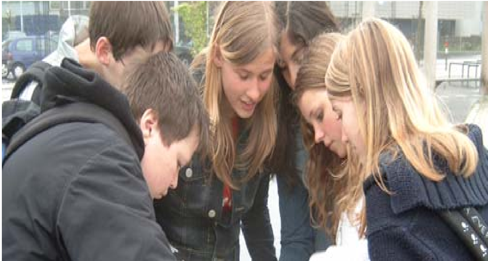
„Viele (Lern)Orte – überall“ Kooperationsprojekt, bsj Marburg