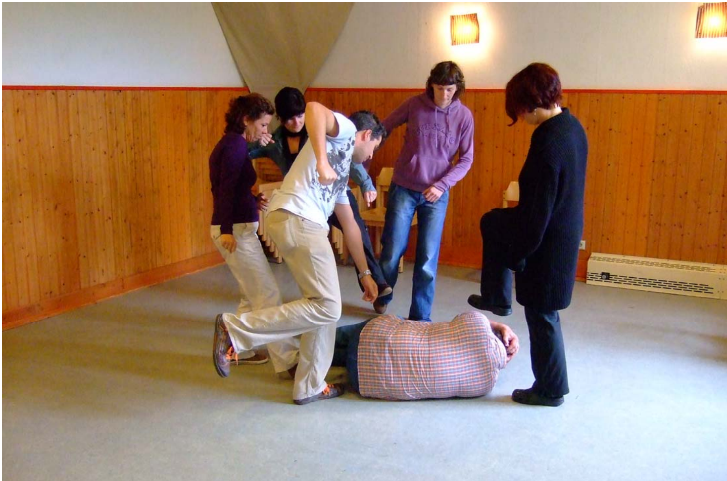
Training mit Standbildern, basa Neu-Anspach und Hda Darmstadt