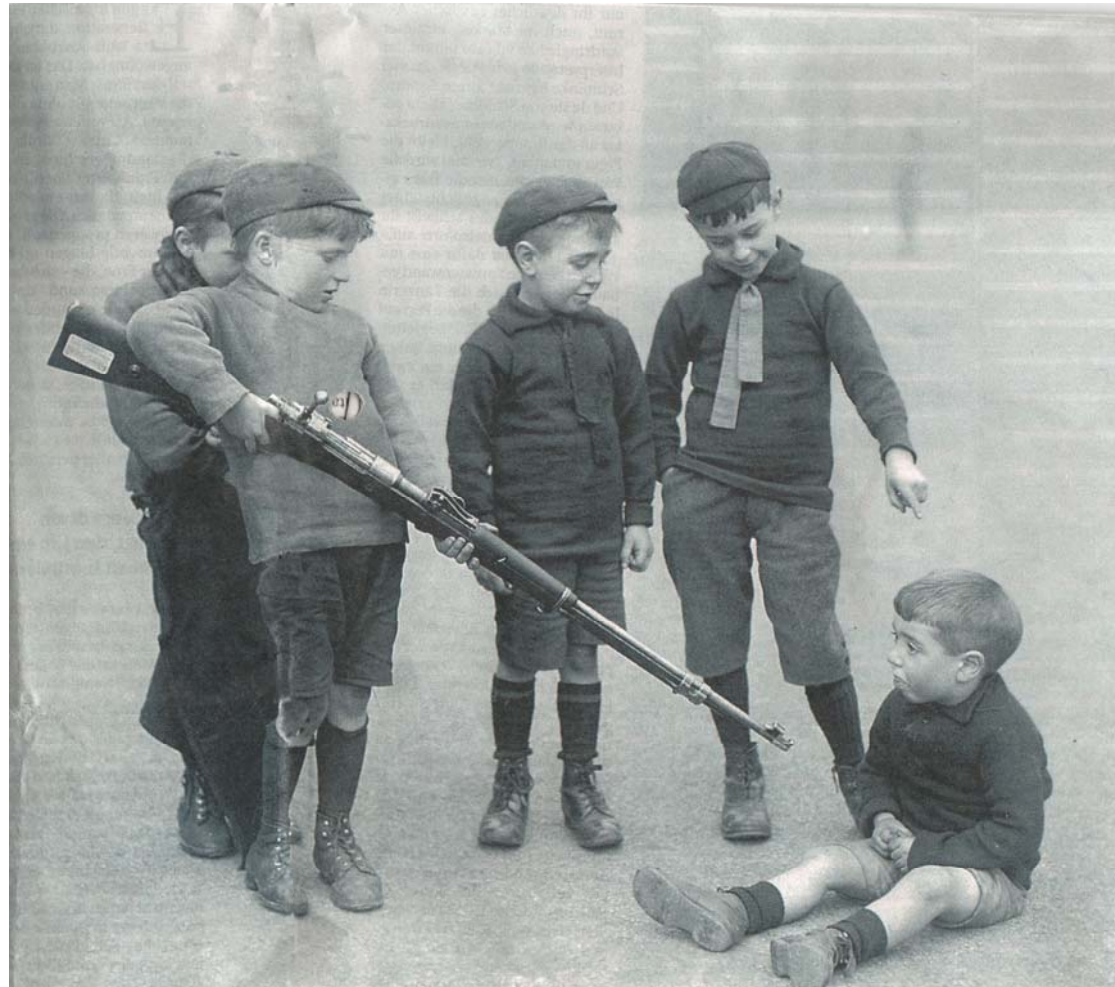
Frankfurter Rundschau vom 18.03.2009. S.30/31